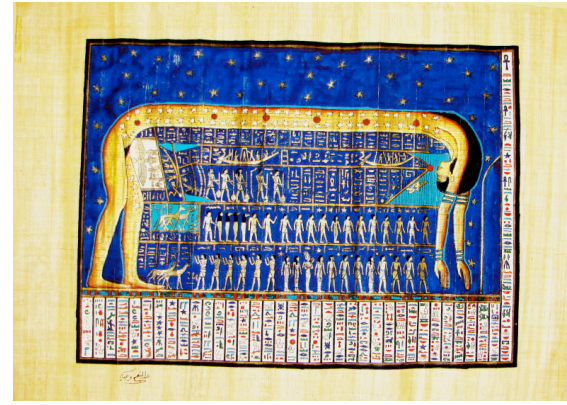
パピルス (エジプト)