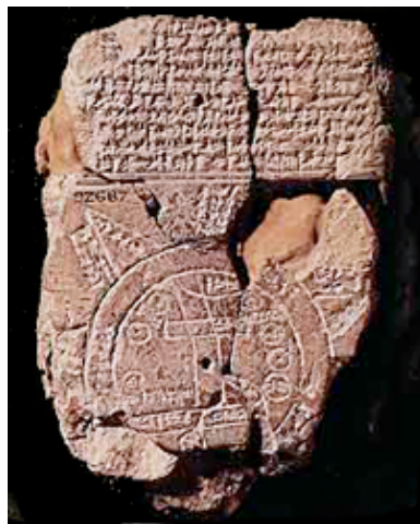
粘土板 (メソポタミア)